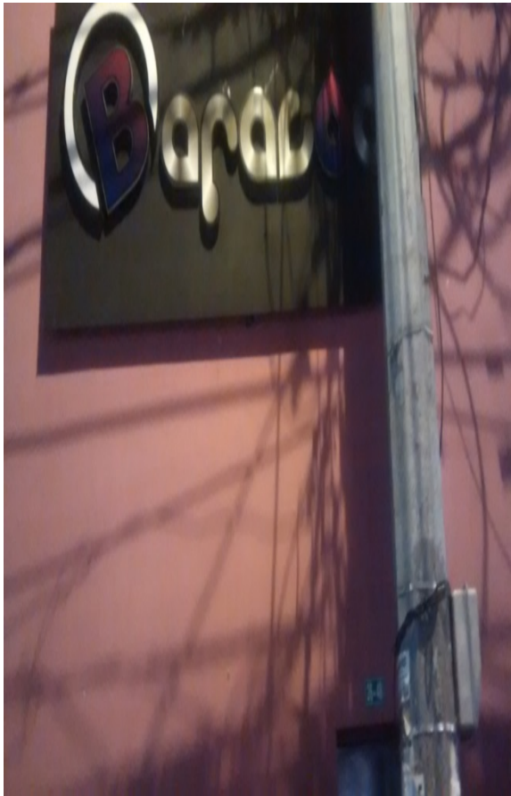
Fotografía No. 1: Visita de requerimiento a la CORPORACIÓN PRIVADA, SOCIAL Y CULTURAL BARACOAS, efectuada el día 14/08/2015.

Registro fotográfico Visitas a la CORPORACIÓN PRIVADA, SOCIAL Y CULTURAL BARACOAS.